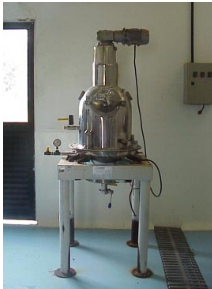
Fig 2. Tacho a vácuo utilizado para desidratação osmótica.

O produto de melão obtido de acordo com o processo descrito anteriormente apresentará características físico-químicas dependentes das condições iniciais do fruto, mas deve-se esperar atividade de água próxima de 0,65, umidade em torno de 14% e pH de 5,6. Nessas condições, o melão é caracterizado como um produto de umidade intermediária e armazenado à temperatura ambiente ( \sim 28^{\circ}\text{C} ) permanecerá estável por pelo menos 180 dias.